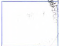
(оттиск КПШ ОПС места вручения уведомления)