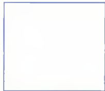
(оттиск КПС ОПС места приема почтового отправления)